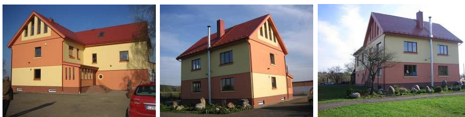
Die fertige Fassade

Begeistert sind wir von den Eigenschaften: trotz der im Vergleich zu Deutschland extremen litauischen Bedingungen von -20^{\circ}\text{C} im Winter bis knapp 30 Grad im Sommer verblasst ThermoShield nicht und es sind überhaupt keine Risse zu sehen, weder an der Holzverkleidung noch am Putz – ein großes Problem vieler Farben hierzulande und bei einem Stadtrundgang durch Vilnius an fast jeder Ecke zu beobachten.“