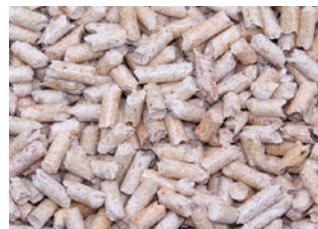
Drei verschiedene Formen des Energieträgers Holz: Scheitholz, Hackschnitzel und Pellets